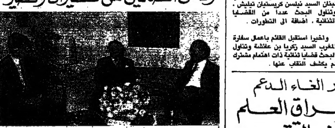
وجه امس وزير العمل والتربية الرئيس الدكتور سليم الحص برفقة تعزية الى الرئيس السوري حافظ الاسد، معزيا بوفاة شقيقه.

وقال الحص في رفاقته: احمر اللعازي القلبية بوفاة المغفور لها شقيقكم تعهدنا الله برحمة الوافرة، واستنها. فسبح جنازة، والهكم الصبر والسلوان. حلفكم الله ذخرا لبليدا الشقيقين وللامة العربية. وكان الرئيس الحص تابع امس الاوضاع الامنية في بيروت الغربية، وسير تنفيذ الخطة الامنية، واطلع من عضوي لجنة التنسيق المهندس محمد قباني والرائد محمد فرشوخ على اخر التطورات وتلقى اتصالا هاتفيا من وزير الدفاع الرئيس عبد عسيران تشاورا خلاله في الترتيبات الامنية. وتلقى الرئيس الحص بعد ظهر امس للذية نفسها اتصالا من المقدم عمر مخزومي.